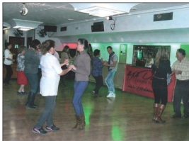
Los alumnos del Taller de Dinamización de Bailes Latinos en un momento de la clase.

"Los corianos somos gente con muchas inquietudes y con conocimientos de muchos tipos por lo que los Talleres de Dinamización Ciudadana son una actividad que beneficia a todos, tanto a los monitores como a los alumnos que pueden desarrollar sus aptitudes tanto físicas como psíquicas, intelectuales o artísticas. Y si algo es bueno para Coria ahí va a estar el nuevo Gobierno", añaden fuentes del Ayuntamiento de Coria del Río.