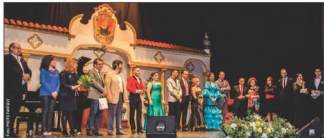
Actividades municipales, Jurado y participantes durante la Gala Final del Certamen 'Pastora Soler'.