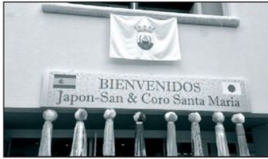
Iglesia de Sendai con la bandera de Coria del Río en su fachada.

También estuvieron frente a un colegio de Primaria