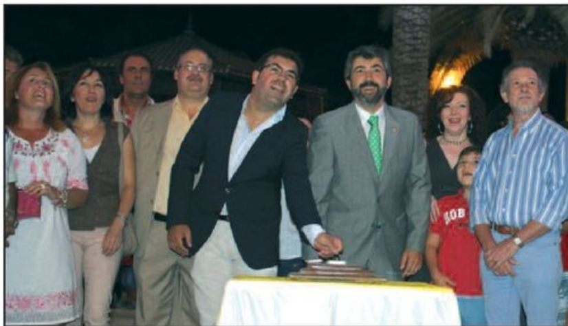
Encendido del alumbrado de la Feria el día de su inauguración por parte del Equipo de Gobierno Local.