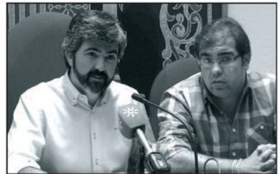
Los responsables del Gobierno Municipal durante una rueda de prensa.

En unos meses desde el cambio de gobierno, las administraciones gobernadas por el PSOE se han lanzado a requerir el dinero mal gastado por el PSOE al frente del