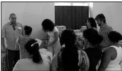
Uno de los repartos de ayuda alimentaria realizados este verano.

Esta ayuda se da por persona, por ello han salido más beneficiadas las familias más numerosas, y siguiendo unos criterios de selección muy estrictos referentes a su situación económica y al grado de exclusión social.