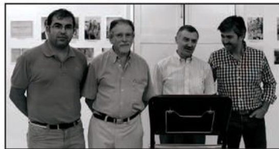
Decídme como se llama el hombre que está al lado de Modesto.

La muestra, organizada por el Centro de Adultos 'Ribera del Guadalquivir' en colaboración de la Delegación Municipal de Cultura del Ayuntamiento de Coria del Río, pretende dar a conocer las distintas perspectivas de una actividad económica que tuvo una gran importancia en esta localidad durante el siglo XX, como fue