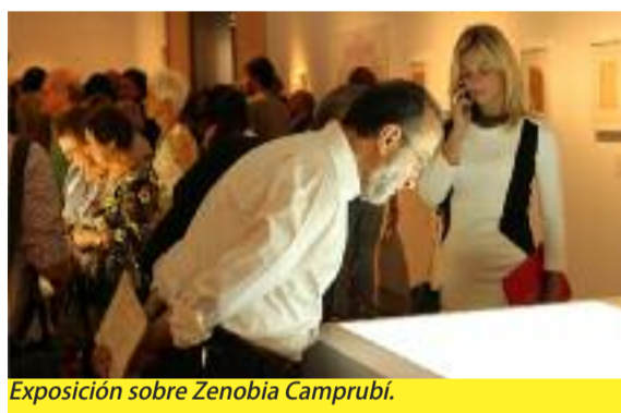
Exposición sobre Zenobia Camprubí.

vencias y pensamientos más íntimos. Traductora, escritora, editora, maestra, reportera... Zenobia Camprubí fue una mujer polifacética y vitalista. Su figura fue eclipsada por la de su marido, el Premio Nobel de Literatura Juan Ramón Jiménez, con quien colaboró activamente en