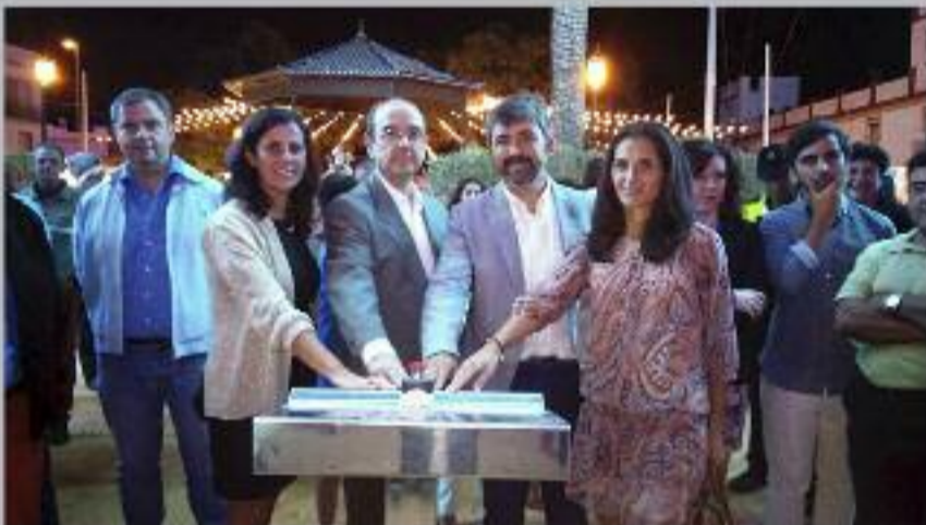
Pistoletazo de salida con el encendido del alumbrado