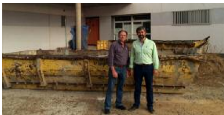
Las obras del Centro de Salud ya han sido reiniciadas.

Una intensa labor, encabezada por el Ayuntamiento de Coria, hace realidad la mejora de la atención sanitaria