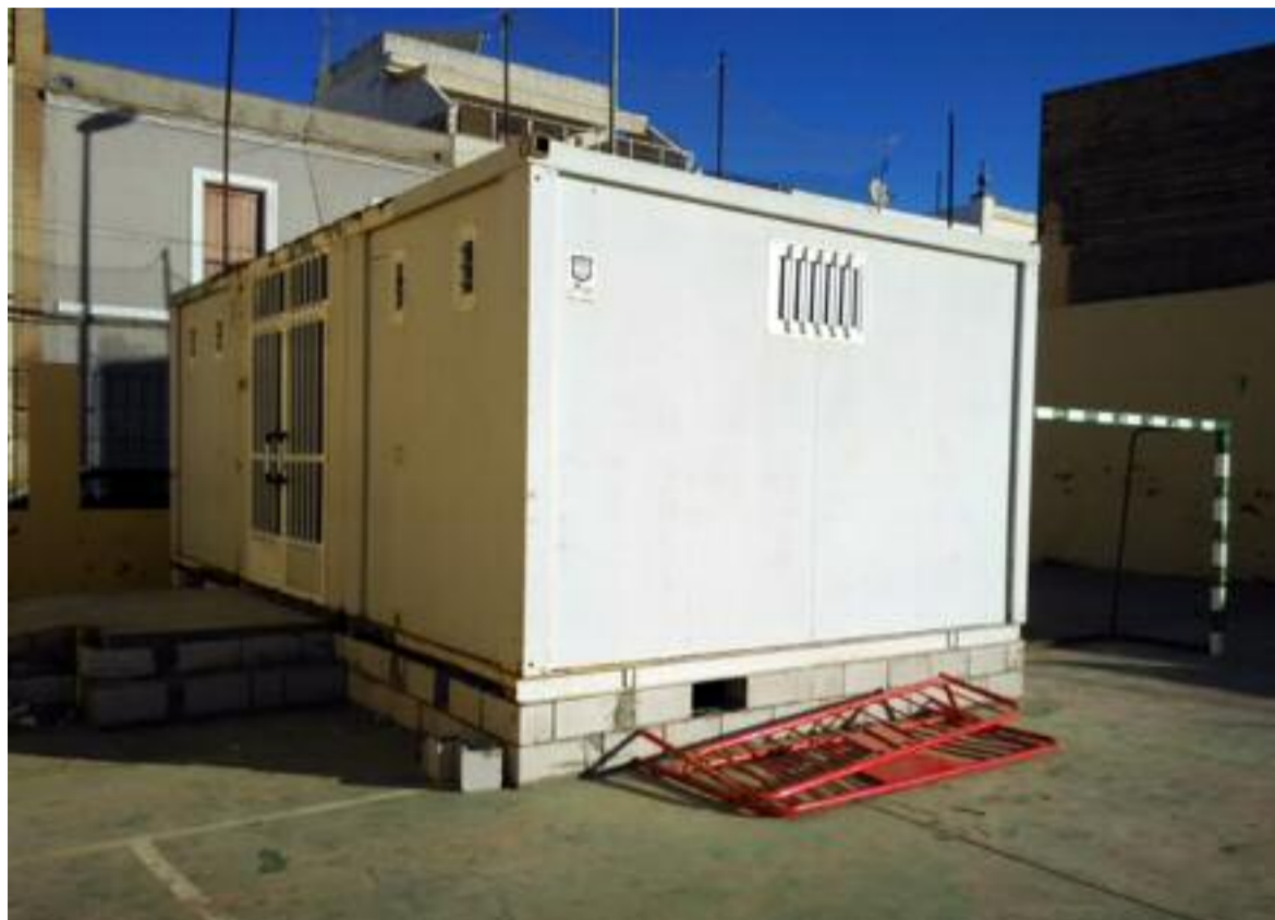
'Caracola' instalada en uno de los centros educativos de Coria del Río.