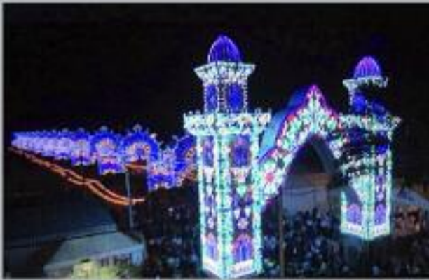
Portada y panorámica de la Feria

Miles de personas han disfrutado un año más de una de las semanas más especiales, la Feria, fiesta declarada de Interés Turístico de Andalucía